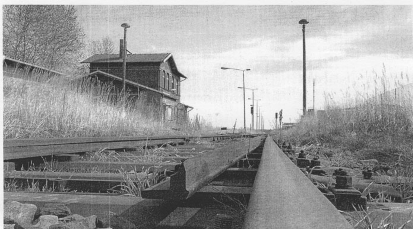
Auch der Bahnhof in Alt Ruppin gehört zu dem Paket, das die Bahn AG jetzt zum Kauf ausgeschrieben hat.